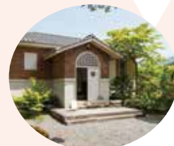
岩倉具視幽棲旧宅