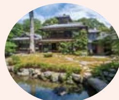
旧三井家下鴨別邸