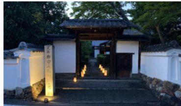
夜間イベント実施の様子