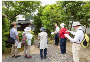
学芸員と史跡を歩く企画 * 写真は2019年度撮影